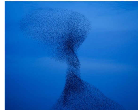
约翰内斯·博斯格拉,《喃喃VIII》左,《喃喃XXIX》右,©约翰内斯·博斯格拉

展期: 2022.12.16-2023.04.09 地点: 三影堂摄影艺术中心(北京草场地155号A)