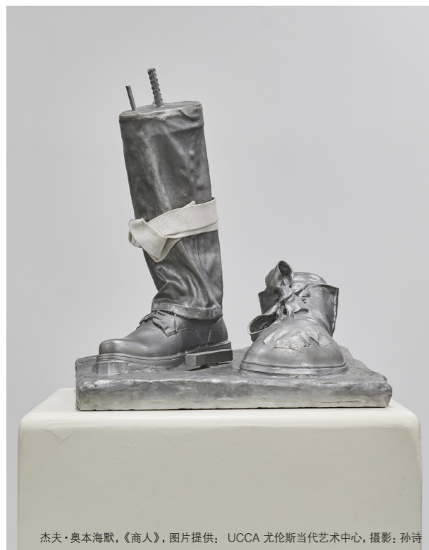
杰夫·奥本海默，《商人》，图片提供：UCCA 尤伦斯当代艺术中心，摄影：孙诗

展期：2022.12.23-2023.04.09 地点：尤伦斯当代艺术中心（UCCA）